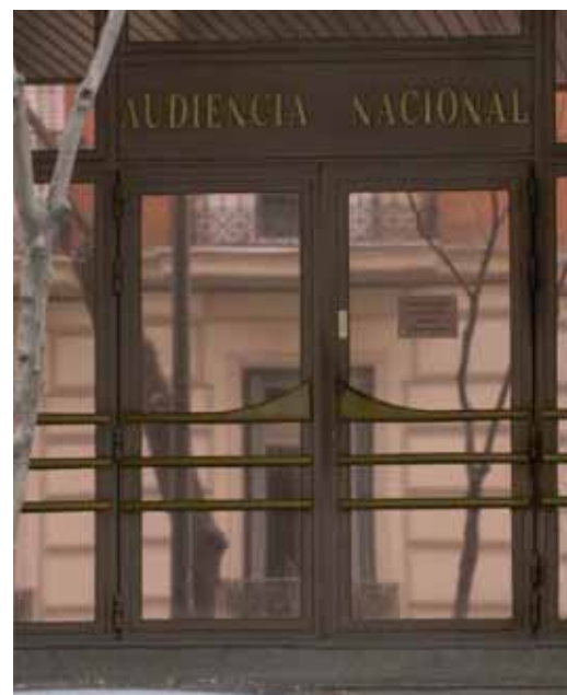
La Audiencia Nacional plantea dudas de inconstitucional

La sala tiene pendientes de resolver al menos otros tres conflictos colectivos sobre personal laboral contratado por el Banco de España, AENA y la Televisión Pública Andaluza.